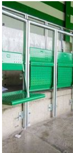
Place assise / debout du Celtic park

En Ecosse , le Celtic de Glasgow a réalisé des travaux à l'été 2016 pour aménager une aire de 2.975 places debout au sein du Celtic Park 19 . La forme des sièges est originale : ces derniers sont intégrés aux barrières anti-panique, ce qui résout le problème de stockage des sièges et permet de transformer instantanément les places debout en places assises.