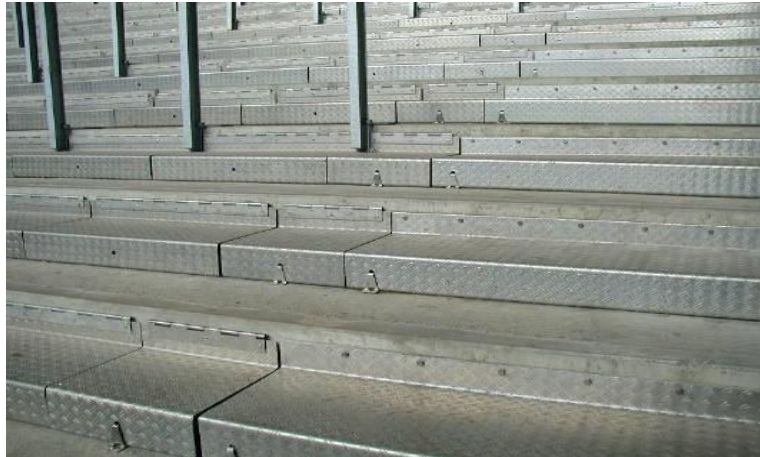
Système de verrouillage des sièges (Hambourg)