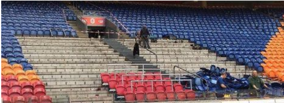
Ajax Amsterdam – ArenA – travaux en cours

En Ecosse , le Celtic de Glasgow a réalisé des travaux à l'été 2016 pour aménager une aire de 2.975 places debout au sein du Celtic Park 19 . La forme des sièges est originale : ces derniers sont intégrés aux barrières anti-panique, ce qui résout le problème de stockage des sièges et permet de transformer instantanément les places debout en places assises.