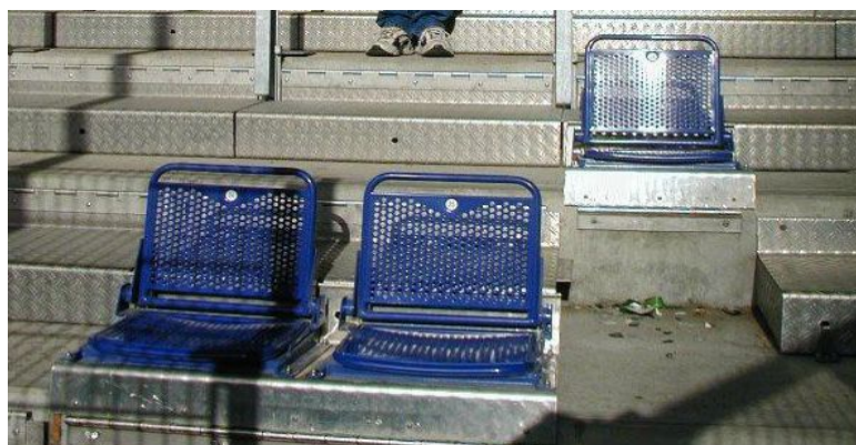
Marche métallique amovible avec siège dépliant intégré (Hambourg)

- le système retenu pour le passage en configuration assise ou debout est proche de celui de Schalke (on retrouve des barrières anti-écrasement retirées en configuration assise). L'aspect novateur à Hambourg réside dans le fait qu'une marche sur deux est une marche métallique, celle-ci pouvant être redressée et complètement renversée vers l'arrière, libérant ainsi un siège dépliant. En configuration debout, les plaquettes métalliques sont verrouillées, ce qui empêche leur ouverture. Le fait de pouvoir conserver les sièges « dans » la tribune constitue une solution au problème de stockage des sièges.