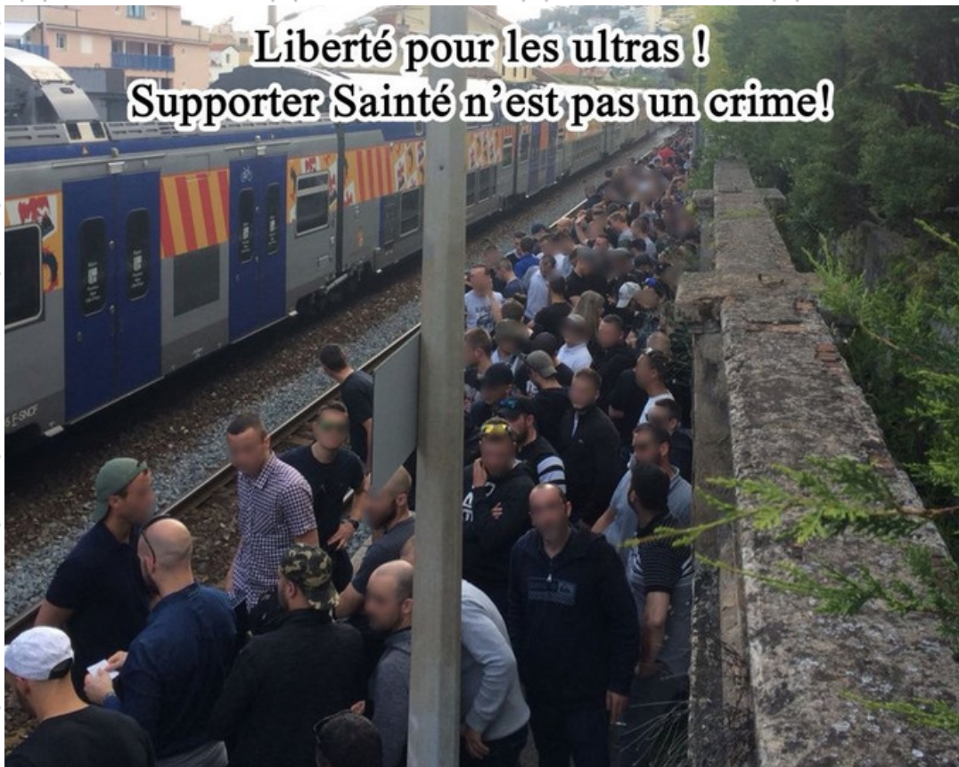
Photo symbolique d'une saison 2017/2018 marquée par des interdictions ou restrictions de déplacement injustifiées et abusives. Ici, les supporters stéphanois renvoyés en Italie après avoir tenté d'assister malgré l'interdiction au match de leur équipe à Monaco.